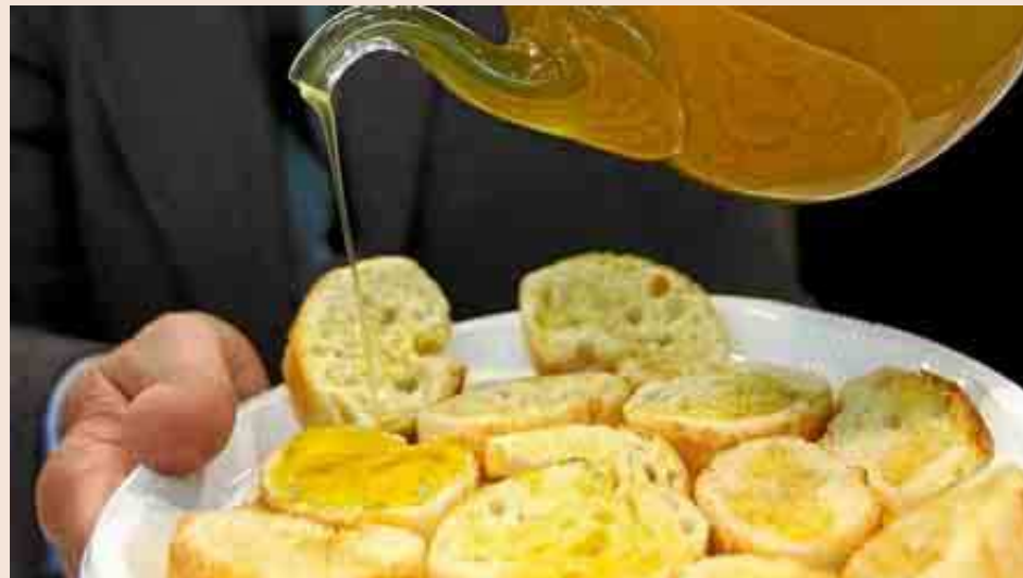
El aceite de oliva es la base del nuevo complemento farmacéutico que lanzará la firma española.

El tratamiento de patologías como el infarto cerebral es un segmento casi huérfano, para el que ahora se utiliza el ácido acetilsalicílico (aspirina) como preventivo. Igen ha aprovechado la falta de opciones para lanzar su nuevo producto, que llegará al mercado tan pronto como la compañía sea capaz de cerrar un acuer-